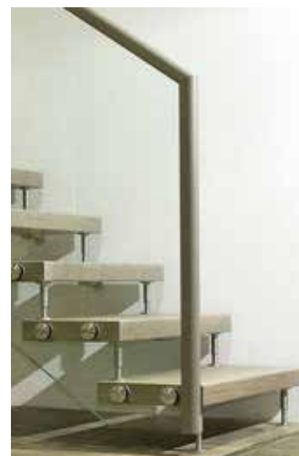
Seitlich befestigtes Ganzglasgeländer CRISTALL mit wählbarem Handlauf/ Kantenschutzprofil (Abb.-Beispiel)